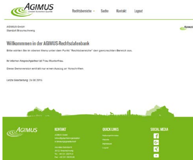
Abbildung 2: Startseite Internetrechtskataster

Auf der ersten Seite erhalten Sie die Information, für welche Standorte das Rechtskataster gültig ist.