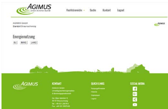
Abbildung 3: Überblickseite z.B. Energienutzung

Durch das Menü am oberen Seitenrand können Sie in die einzelnen Rechtsbereiche gelangen. Dort erhalten Sie eine Übersicht der Vorschriften für den jeweiligen Bereich, die Ihr Unternehmen betreffen.