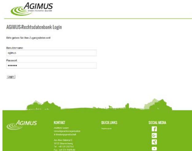
Abbildung 1: Internetzugang Rechtskataster

Auf der ersten Seite erhalten Sie die Information, für welche Standorte das Rechtskataster gültig ist.